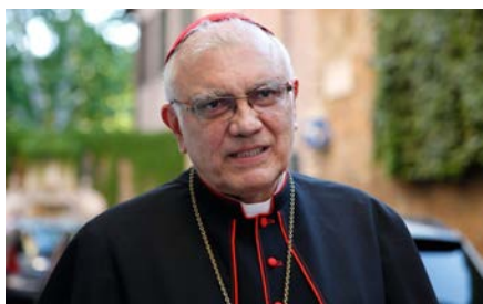
Cardenal Baltazar Porras Cardozo. Administrador Apostólico de la Arquidiócesis de Caracas y Arzobispo de la Arquidiócesis de Mérida. Miembro de la Pontificia Comisión para América Latina y Presidente delegado del Sínodo para la Amazonía